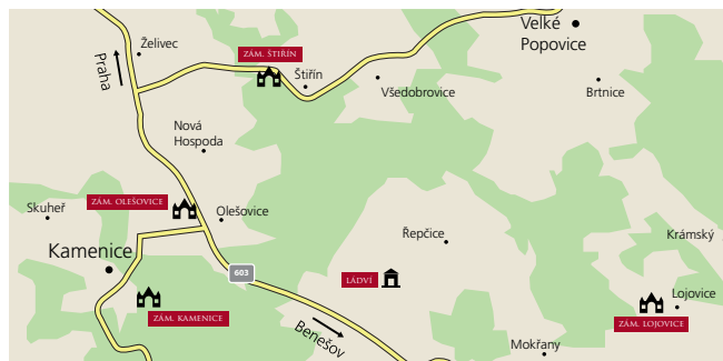
Mapa části středních Čech s vyznačením míst spojených s akcí „zámky“.

V době 2. světové války pomáhal židovským rodinám. Velký obdiv si zasloužil ojedinělá humanitární akce spojená s péčí o židovské děti, které se po skončení 2. světové války vracely z koncentračních táborů. Tuto akci „zámky“ brzy rozšířil i na německé děti z českých internačních táborů. Po únoru 1948 byl komunistickému režimu čím dál tím víc nepohodlný. V roce 1951 byl nucen uprchnout do exilu.