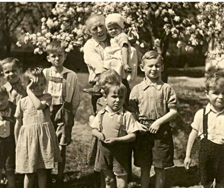
P. Pitter s dětmi v parku u Lékařského domu v Olešovicích.

Život a dílo Přemysla Pittra a s ním spojené osudy lidí byly ovlivněny dějinnými zvraty, které přineslo 20. století. P. Pittra v mládí hluboce poznamenala smrt obou rodičů a hrůzná zkušenost z fronty 1. světové války, což ho přivedlo k rozhodnutí zasvětit celý svůj život pomoci druhým lidem – hlavně dětem. Ve 20. a 30. letech 20. století působil na pražském Žižkově, kde se mu s pomocí přátel podařilo vybudovat zařízení pro mimoškolní výchovu dětí – Milíčův dům . Kromě pedagogické činnosti se P. Pitter zapojil do mírového hnutí a věnoval se publikační činnosti. Jeho nejbližší spolupracovníci se stala Švýcarka Olga Fierzová.