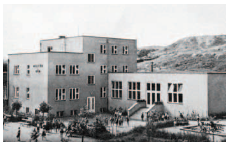
Milíčův dům po dostavbě v r. 1936.

Život a dílo Přemysla Pittra a s ním spojené osudy lidí byly ovlivněny dějinnými zvraty, které přineslo 20. století. P. Pittra v mládí hluboce poznamenala smrt obou rodičů a hrůzná zkušenost z fronty 1. světové války, což ho přivedlo k rozhodnutí zasvětit celý svůj život pomoci druhým lidem – hlavně dětem. Ve 20. a 30. letech 20. století působil na pražském Žižkově, kde se mu s pomocí přátel podařilo vybudovat zařízení pro mimoškolní výchovu dětí – Milíčův dům . Kromě pedagogické činnosti se P. Pitter zapojil do mírového hnutí a věnoval se publikační činnosti. Jeho nejbližší spolupracovníci se stala Švýcarka Olga Fierzová.